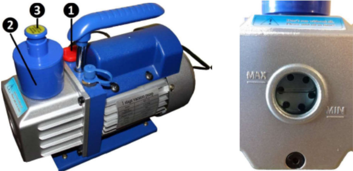
Abbildung links: Teile der Pumpe & Abbildung rechts: der richtige Ölstand